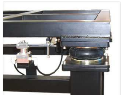
ATシリーズを組込んだ除振台(フレーム)